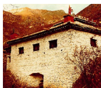
The "Temple Of Miraculous Fire" at Muktinath, Nepal. Photo by Ken Street (November 1979).

[For more on this subject, please read our tract The Temple Of Miraculous Fire .]